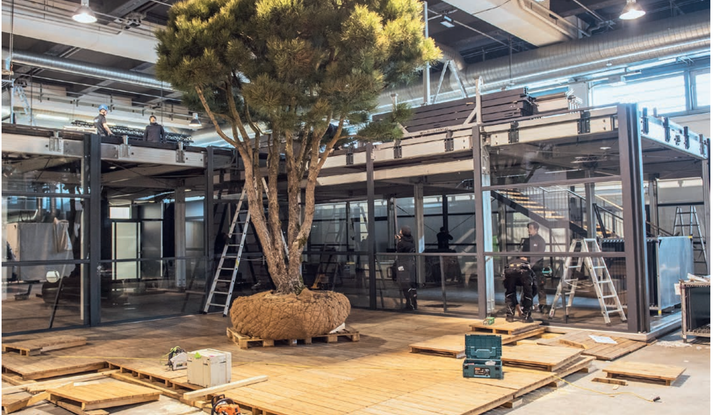
2018 war noch alles in Ordnung. Da konnten Pflanzen geliefert und auch in Schaugärten integriert werden.