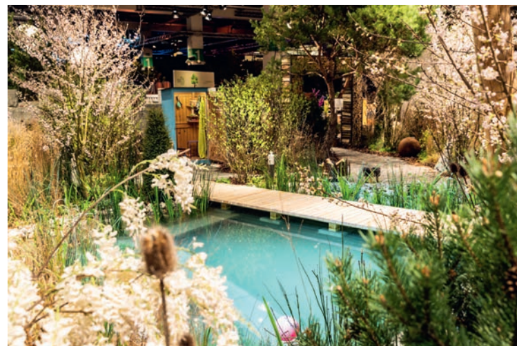
Zwei Giardina-Gartenwelten anno 2019: Links der Schaugarten von Berger Gartenbau AG «Secret Garden», rechts «Mein Naturgarten» von Winkler Richard Naturgärten.